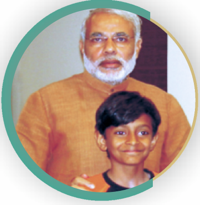
અલોહા ગુજરાતના બાળકની સ્કીલ્સને પ્રોત્સાહન આપતા શ્રી નરેન્દ્ર મોદી