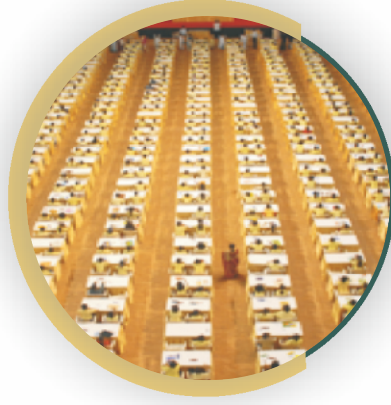
અલોહાની સુરત ખાતે યોજાયેલ નેશનલ કોમ્પીટીશનનું એક દ્રશ્ય