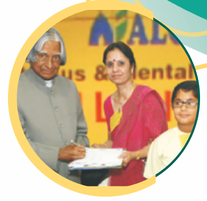
અલોહા ગુજરાતના બાળકોને ઓટોગ્રાફ આપતા સ્વ. શ્રી એ.પી.જે અબ્દુલ કલામ